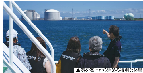
▲港を海上から眺める特別な体験！