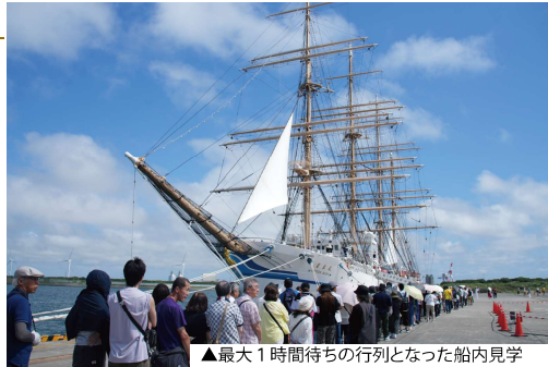
▲最大1時間待ちの行列となった船内見学

石狩湾新港開港30周年記念フェスタは、天候に恵まれたこともあり、2日間で想定以上の多くの方が来場しました。特に、帆船「日本丸」の一般公開に期待している方が非常に多く、船内見学の開始前には、長蛇の列ができるほど人気となりました。この船内一般公開では、「ただ船内を見るだけでなく、乗組員や実習生から航海中や実習中のお話を聞いた」「椰子の殻を使って甲板を掃除する椰子摺り体験等、貴重な経験ができた」など、来場者からは多くの喜びの声が寄せられました。