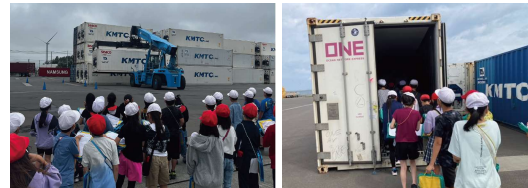
▲大きなコンテナを軽々と運ぶと歓声があがった ▲子どもたちから「コンテナ内がとても涼しい」と感想があがった

また、コンテナヤードを見学した小学校の児童からは、コンテナを目の前に「このコンテナはどこから運ばれてきたのか？」「何が運ばれてくるのか？」など次々と質問があがり、当組合職員の説明によりコンテナ輸送の仕組みに対する理解を深めるとともに、港湾や物流が自身の生活を支える重要な存在であることを学びました。さらに、ガントリークレーンやリーチスタッカー等の大型の港湾荷役機械がどのように動くかにも強い関心を示し、目を輝かせながら質問を続けていました。