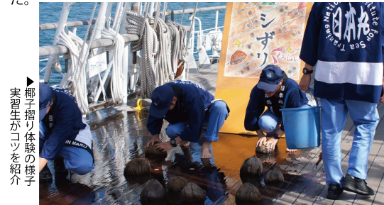
▶椰子摺り体験の様子 実習生がコツを紹介