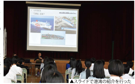
▲スライドで港湾の紹介を行った

出前授業を行った中学校では、港湾の役割や本港での取扱貨物の特徴を紹介し、世界とつながる港が地元であることを説明しました。生徒は、「自分の住んでいる地域にコンテナ船が入ることを知らなかった、勉強になった」と感想を話していました。