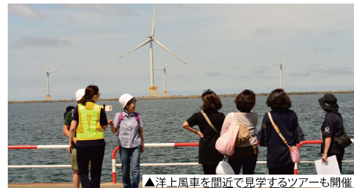
▲洋上風車を間近で見学するツアーも開催

また、会場内では「日本丸」を所有する独立行政法人海技教育機構のブース出展もあり、小樽市にある学校の説明や御船印等のオリジナルグッズの販売が行われました。特に子ども達には、船員の制服を実際に着用することができる体験が大変人気で、多くの親子が記念撮影を楽しんでいました。