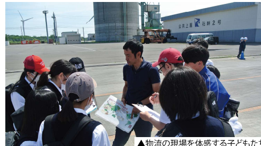
▲物流の現場を体感する子どもたち